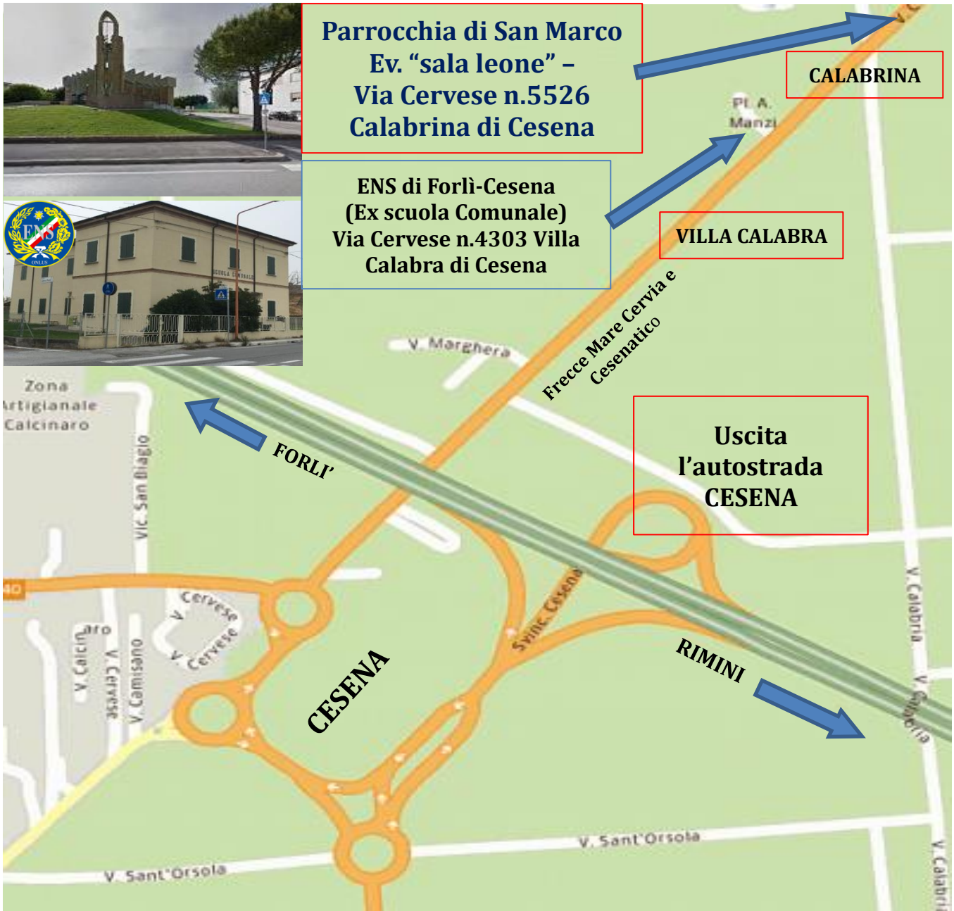
MAPPA A CESENA (FC)